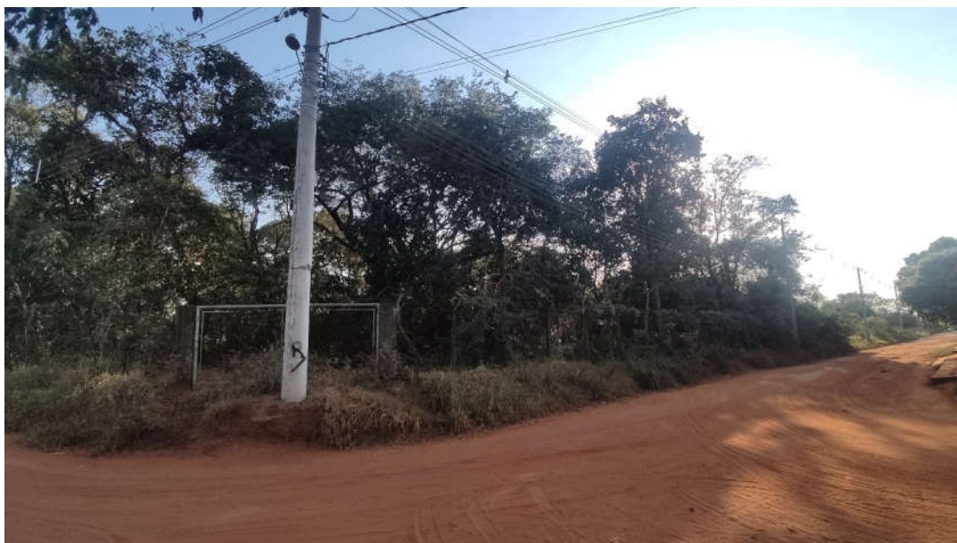
Rua N 02, Vila Trindade – AQUIDAUANA-MS